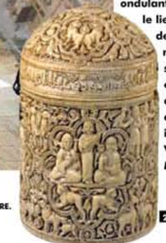
1- COUVERTURE MÉTALLISÉE DE LA COUR INTÉRIEURE. 2- ARTS DE L'ISLAM AU LOUVRE.

Cela faisait vingt ans (depuis la construction de sa Pyramide) que le Louvre n'avait pas connu pareil bouleversement architectural. Pour accueillir le tout nouveau département des Arts de l'Islam, les architectes Rudy Ricciotti et Mario Bellini ont investi la cour Visconti et l'ont recouverte d'une verrière ondulante. Une voile-œuvre d'art qui fait le lien entre les lignes néoclassiques de cette cour du XVII ème siècle et son nouveau contenu: jusqu'ici simple section du département des Antiquités orientales, les Arts de l'Islam comprennent plus de 2 500 œuvres couvrant l'ensemble de la civilisation islamique, de l'Espagne à l'Inde, du VII ème au XIX ème siècle. Place du Louvre, 75058 Paris.