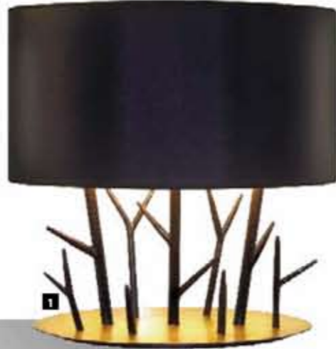
1- LAMPE JACINTHE PAR ERIC ROBIN.